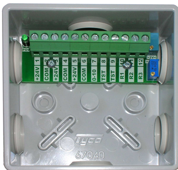
Вид со снятой крышкой